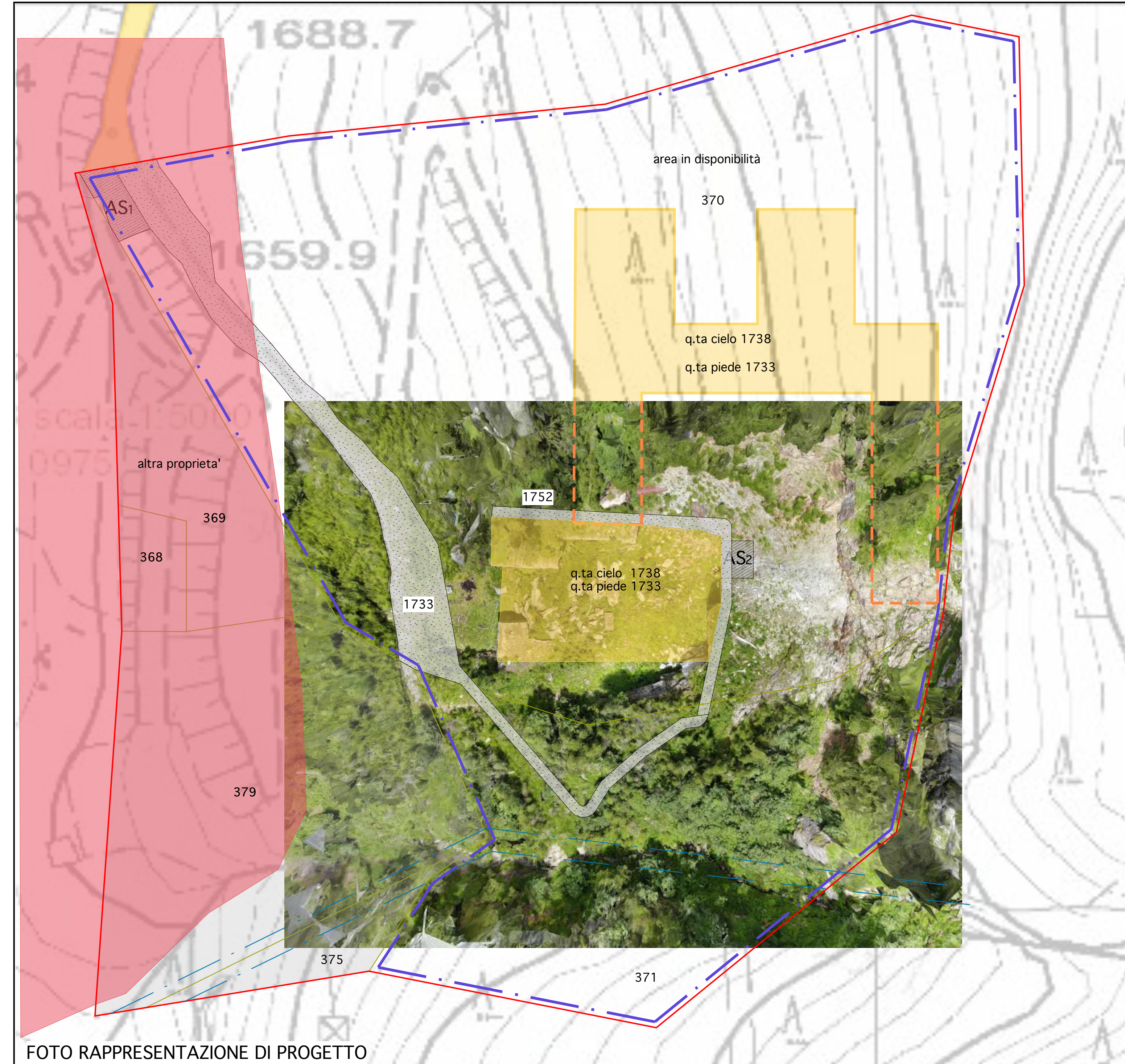
FOTO RAPPRESENTAZIONE DI PROGETTO